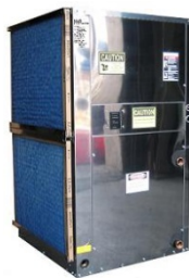
Pompe à chaleur Inox Très haute température 80°C Monobloc gainable