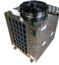
Pompe à chaleur Inox Très haute température 80°C monobloc